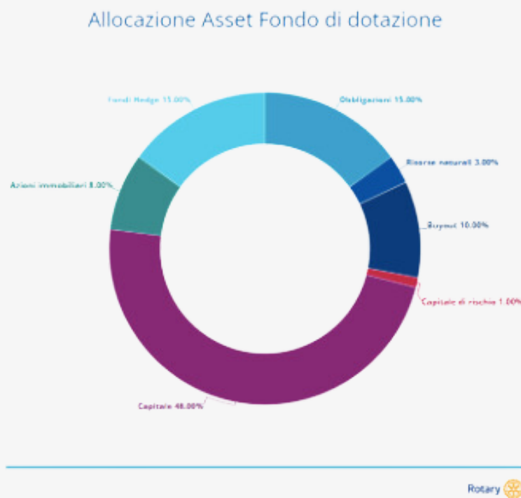
Figure 2.2: Prospetto allocazione degli asset del Fondo di dotazione (anno fiscale 2021)

Il portfolio è costituito per l'85% in attività che producono utili simili a titoli azionari, un prospetto più dettagliato è riportato nella Figure 2.2 . Negli ultimi cinque anni il Fondo di dotazione è cresciuto da 483 milioni a 523 milioni di dollari, producendo un utile medio annuo del 10,3%. Il tasso di rendimento è il totale degli utili di capitale sommato agli interessi e dividendi. Inoltre, in Figure 2.3 viene riportato l'andamento di mercato del Fondo di dotazione dal 1985, anno in cui è stato deciso dal CdA della RF di impiegare i contributi del fondo in modo da generare utili per aumentare la capacità di sostegno ai programmi della Fondazione.